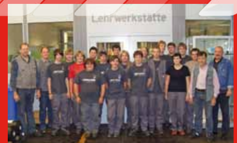
Im Herbst begannen 17 junge Menschen ihre Ausbildung bei Welser Profile im niederösterreichischen Werk Gresten.