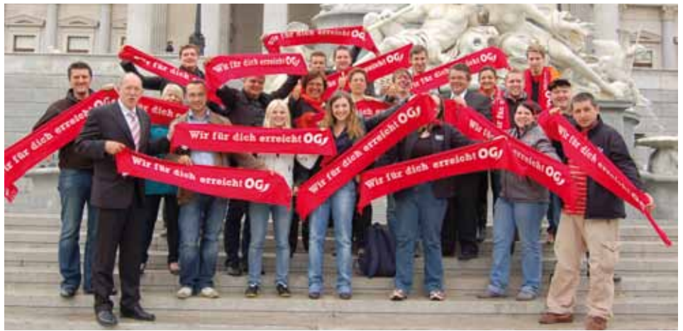
Gewerkschaftsjugend erreichte mehr Mitbestimmung für über 10.000 Jugendliche.

Mit der überbetrieblichen Lehrlingsausbildung wurde ein wichtiges Auffangnetz für jene Jugendlichen geschaffen, die keine Lehrstelle gefunden haben. Während die PRO-GE-Jugend diese Maßnahme begrüßt, kritisiert sie zugleich die Verantwortungslosigkeit der Betriebe. „Einerseits wird Fachkräfteman-