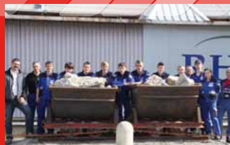
Alle zehn Lehrlinge, die heuer bei RHI Veitsch Radex in der Steiermark ihren Lehrberuf starteten, sind der Gewerkschaft PRO-GE beigetreten.