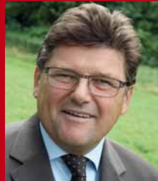
Rainer Wimmer, Bundesvorsitzender der PRO-GE

Die EU-Beamtengehälter steigen trotz Krise deutlich. Die Vertreter der 27 EU-Staaten hatten beschlossen, die Gehälter der EU-Bediensteten um 1,85 Prozent zu erhöhen und nicht wie von der Kommission vorgeschlagen um 3,7 Prozent. Der Europäische Gerichtshof (EuGH) hat im November diese reduzierte Gehaltserhöhung gekippt. Pikant dabei ist, dass auch die EU-Richter von der Anpassung der Gehälter betroffen sind und somit im aktuellen Fall auch über ihre eigene Erhöhung entschieden. Die Gehaltserhöhung gilt für 2010 und rückwirkend ab Juli vergangenen Jahres.