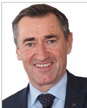
General Franz Lang Direktor des Bundeskriminalamts

Im privaten Umfeld Gewalt gegen die eigene Person zu erleben, ist für Betroffene – neben den körperlichen Verletzungen – erniedrigend und entwürdigend.