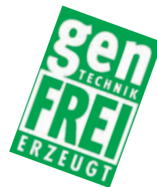
Das Siegel der ARGE Gentechnik-frei

www.gentechnikfrei.at: Diese Website bietet aktuelle Gentechnik-Einkaufslisten zum Download.